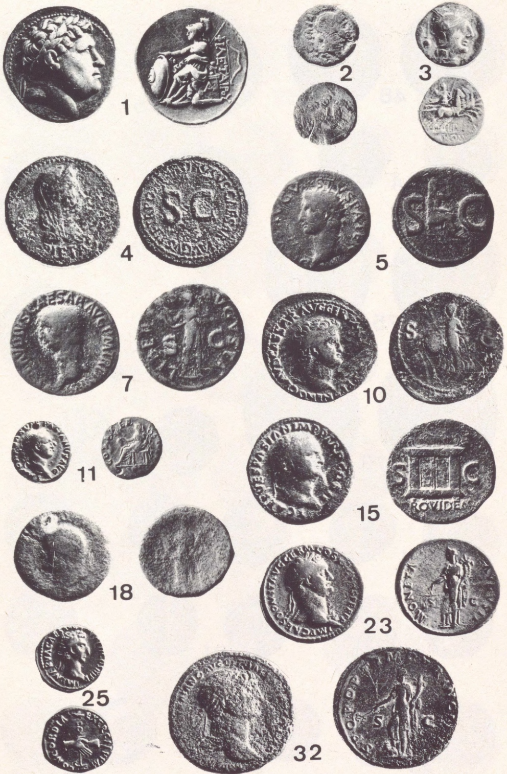
Abb. 1 Römische Münzen aus dem Historischen Museum der Stadt Krems