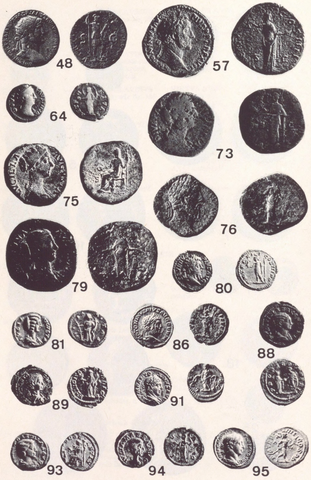
Abb. 2 Römische Münzen aus dem Historischen Museum der Stadt Krems